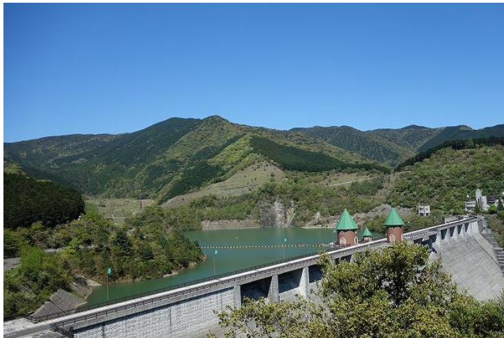
【鳴淵ダムから歎原山】