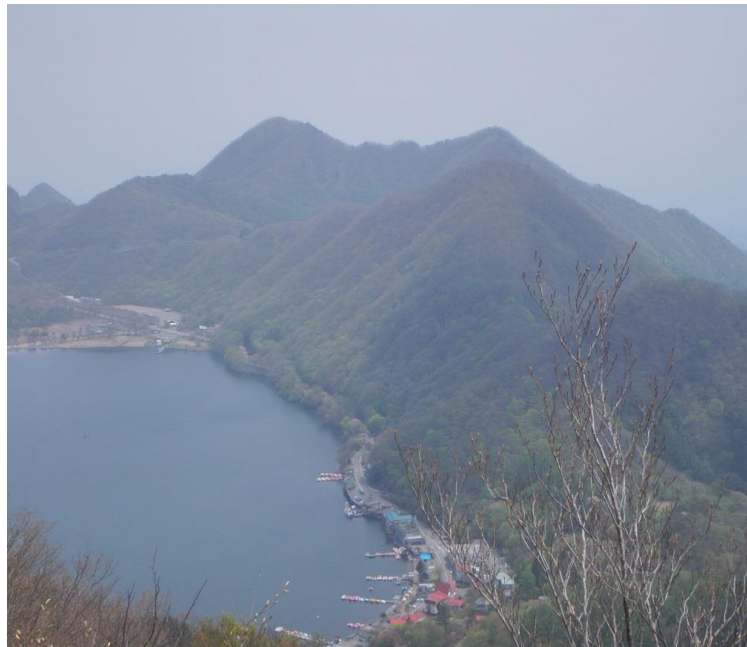
榛名外輪と 榛名湖

このコースは、また、歩けると思う。いつの日か、ヤマツツジに縦走路が覆われた時期に歩きに来よう。今度は、何年後かしら・・・？