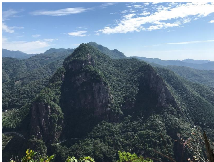
( 矢筈岳東峰から望む比叡山 )