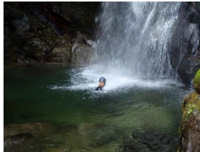
【滝行するDr きもちよさそう】