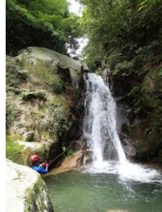
【水中ビレイするH田さん】