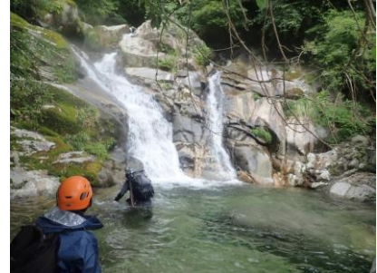
【滝をのぼるのか・・・と思っている】